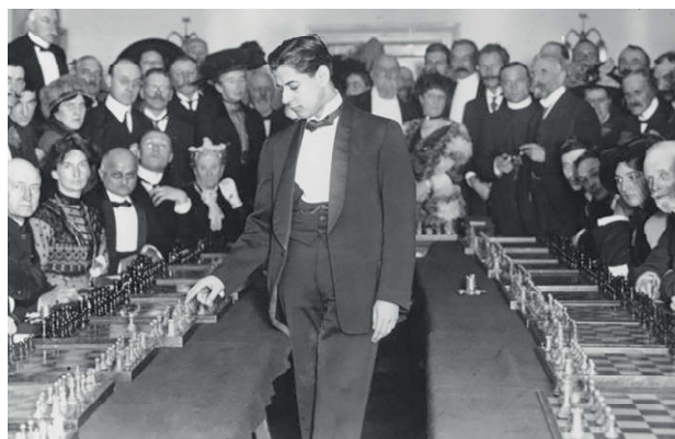
Simultanée à Londres en 1911

Meilleur joueur de Cuba dès l'âge de 13 ans, Capablanca poursuit ses études en Amérique, d'abord dans une école privée du New Jersey, puis à l'université Columbia. Élève brillant, il passe avec succès l'examen d'entrée en n'utilisant qu'une heure sur les trois allouées... Puis le virus du jeu l'incite à pousser les portes du fameux Manhattan Chess Club, où son talent laisse les autres membres pantois. Sa célébrité grandissante et ses études de côté, Capablanca entreprend en 1908 un grand tour d'Amérique lors duquel il multiplie les exhibitions. Son score total (+703 =19 -12) fait sensation et provoque un match face au champion national, l'un des tout meilleurs joueurs au Monde, Marshall. À vrai dire de match il n'y eut pas vraiment, Capablanca s'imposant sur le score sans appel de huit victoires à une ! Non sans humour, l'Américain confiera plus tard que son jeune adversaire semblait ennuyé pendant leurs parties, parfois au bord de la somnolence, et que sa plus grande erreur avait été de le réveiller ! Pas rancunier, Marshall soutient la participation du Cubain au tournoi de Saint-Sébastien en 1911, regroupant la plupart des meilleurs joueurs européens, qui marque la première grande victoire internationale de Capablanca.